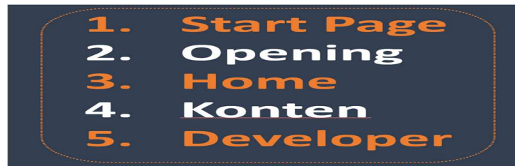
Gambar 3. Urutan Design Media SAC 3.0