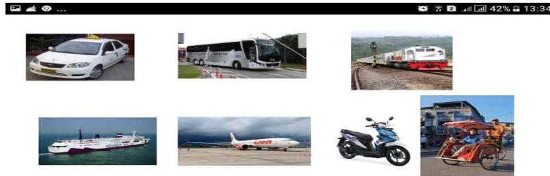
Gambar 7. Halaman Materi Utama dari Aplikasi SAC 3.0

peta konsep dibuatnya aplikasi SAC 3.0. media pembelajaran BIPA dasar. Awalan ini memberi petunjuk materi yang akan diputar dalam bentuk gambar moda transportasi di Indonesia disertai teks dan audionya. Lihat gambar di bawah ini: