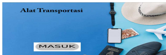
Gambar 5. Halaman Loading dari Aplikasi SAC 3

Halaman loading dan cover aplikasi merupakan halaman pembuka dari media SAC 3.0. sebagai Media Pembelajaran BIPA Dasar. Di dalam tampilan awal, cover warna biru mendominasi layar. Tertulis judul Alat Transportasi dengan tambahan ilustrasi gambar berupa serangkaian benda yang biasa dipakai untuk bepergian yaitu jam tangan, topi, telepon genggam, pesawat, paspor, dan sepatu. Setelah masuk halaman loading ini untuk memasuki halaman selanjutnya maka klik tulisan MASUK yang terdapat pada pojok kiri bawah halaman yang dapat dilihat pada gambar sebagai berikut: