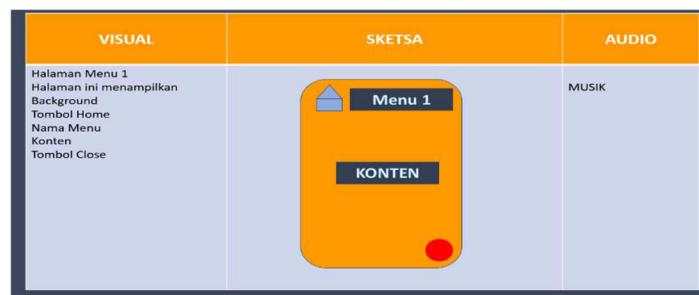
Gambar 2. Tampilan rancangan Storyboard

Konsep dibuat di awal tahapan karena dipakai sebagai panduan keseluruhan program menuju ketercapaian tujuan. Konsep awal dibuat berisi tujuan media pembelajaran ini ditujukan pada pembelajar BIPA level 1 yaitu BIPA dasar. Kesesuaian semua sumber materi BIPA dasar dicari dari sumber belajar di laman Badan Bahasa bagian BIPA. Konsep lanjutan yang dibuat adalah pembuatan naskah rancangan media yang akan dibuat diurutkan sesuai tampilan dari awal aplikasi sampai bagian akhir tampilan layer di android. Seluruh naskah ini dirangkum dalam storyboard . Storyboard sebagai tempat rancangan urutan tampilan yang akan dibuat dalam aplikasi di android. Berikut ini tampilan storyboard yang sudah dibuat: